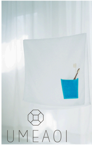
タオルのアトリエ。 ウメアオイ